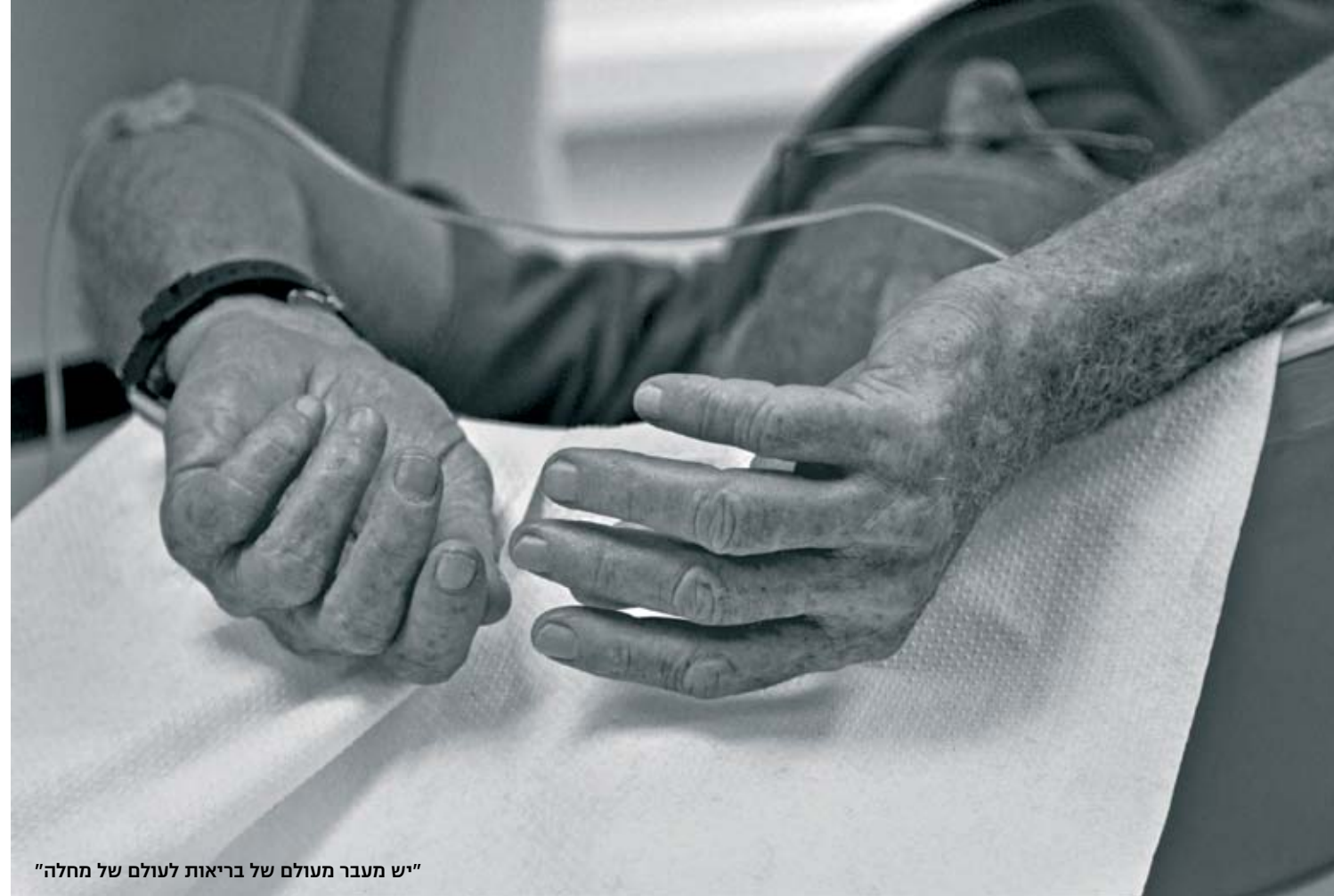
"יש מעבר מעולם של בריאות לעולם של מחלה"