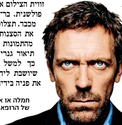
חמלה או אמפתיה נובעת מהאופי של הרופא. ד"ר האוס

זווית הצילום אינטימית, אך לרגע לא פולשנית. בר-מאיר שומר על ריחוק מכד. תצלומי שחור-לבן מצמצמים את הסצנות ומוקפים אותן. בחלק מהתמונות אין פנים, אך יש מעין תיאור גנרי של חולה, של מבקר. כך למשל בתמונה של מבקרת שיושבת ליד מיטת חולה, ומליטה את פניה בידיה, אולי יושבת שם