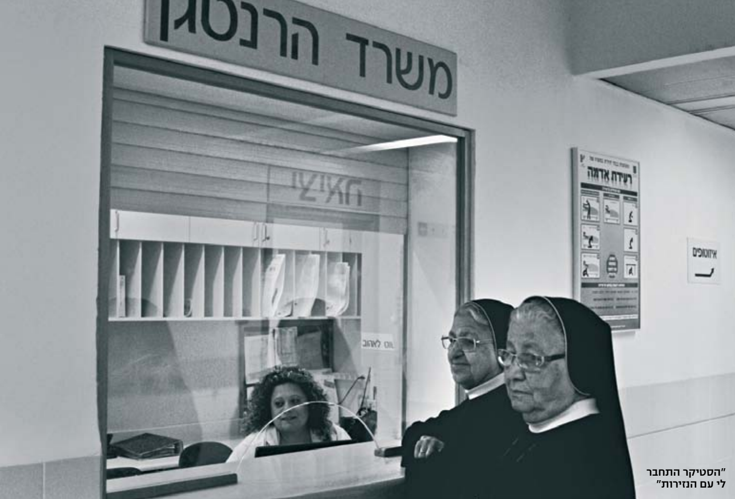
"הסטיקר התחבר לי עם הניירות"