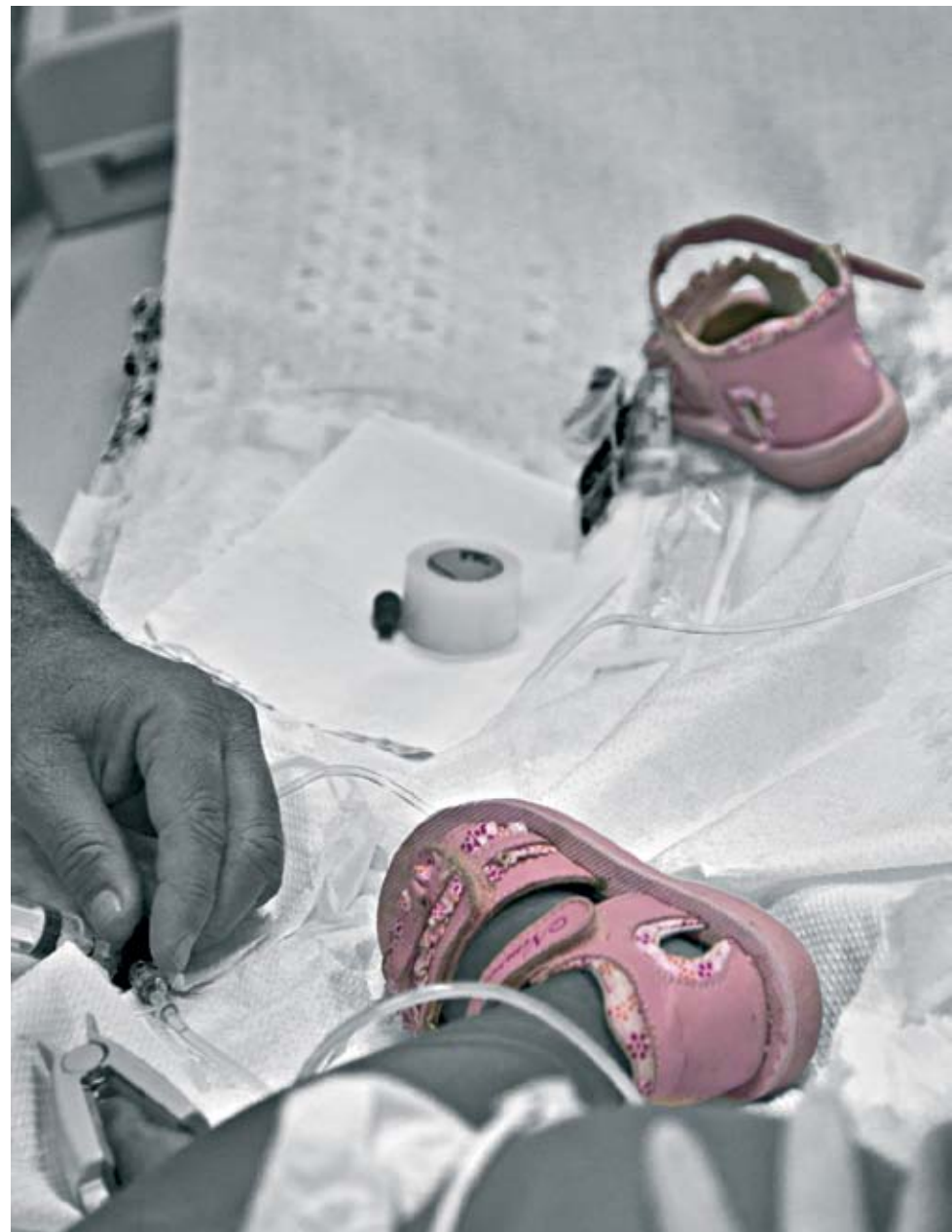
"הנעל המיומנת מספרת טוב יותר מכל המהומה שמסביב"

"למעשה אני מצלם כל ימיי - בצילום רנטגן, שבו כעצם מסתכלים פנימה. אפשר לומר שאנו בוחנים כל כליה ולב וירטואליים על ידי חתך של מכשירי סריקה, כשהעין רק בוחנת את הממצאים שעולים מהמכשירים,